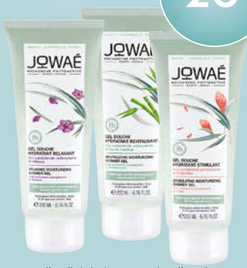
Dušas želeja ķermeņa kopšanai