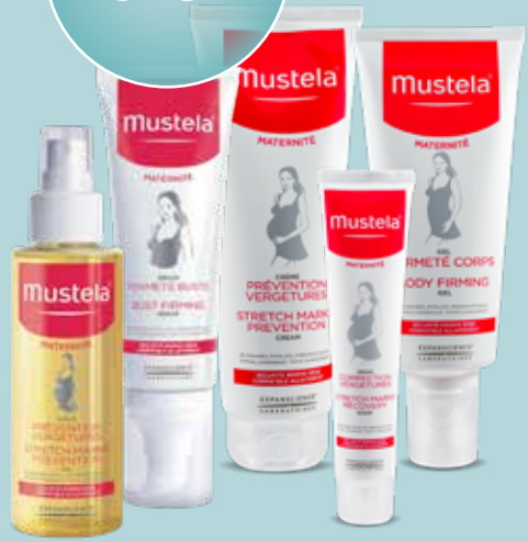
Ķermeņa ādas kopšanai