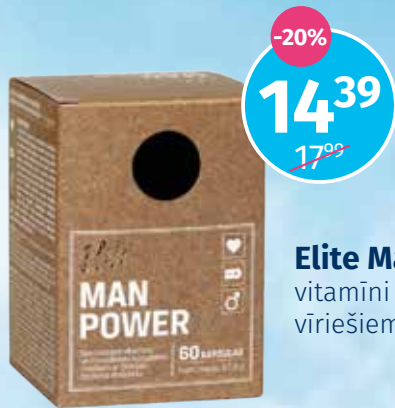
Elite Man Power vitamīni un minerālvielas vīriešiem, kapsulas N60