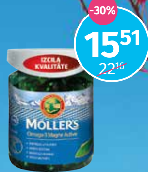
Mollers Omega Active aktīvam dzīvesveidam, kapsulas N100