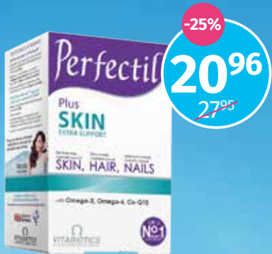
Perfectil Plus SKIN vitamīni ādai, matiem un nagiem, tabletes N28+ kapsulas N28