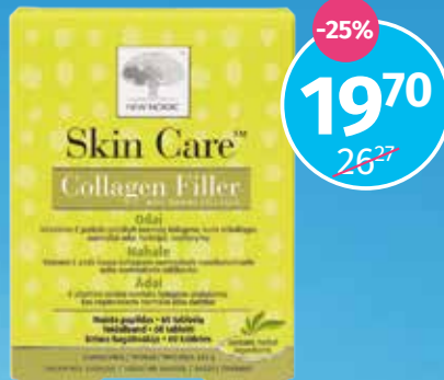
Skin Care Collagen filler kolagēns ādai, tabletes N60