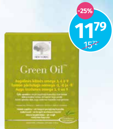
Green Oil omega 3, 6 un 9 taukskābju komplekss, kapsulas N60

UZTURA BAGĀTINĀTĀJS! UZTURA BAGĀTINĀTĀJS NEAIZSTĀJ PILNVĒRTĪGU UN SABALANSĒTU UZTURU.