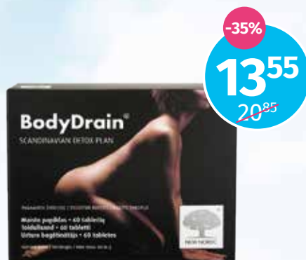
BodyDrain organisma attīrīšanai, tabletes N60