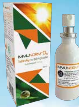
Immunorm D3 aerosols 50 ml D vitamīni avots