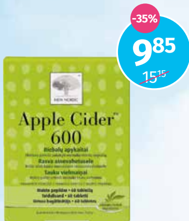
Apple Cider tauku vielmaiņai, tabletes N60