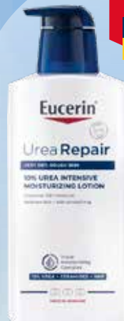
EUCERIN UreaRepair PLUS ķermeņa losjons ļoti sausas, raupjai ādai 400 ml