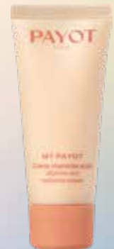
My Payot vitaminizēts krēms sejas ādai 30ml