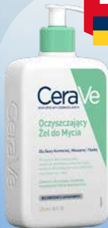
CeraVe Foaming Facial Cleanser sejas tīrīšanas līdzeklis 473 ml