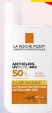
LA ROCHE-POSAY Anthelios UVMune 400 SPF 50+ saules aizsarglīdzeklis 50 ml