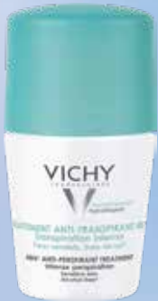
VICHY Antiperspirant dezodorants jutīgai ādai 50 ml