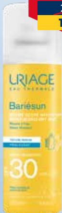
URIAGE Bariesun SPF30 saules aizsarglīdzeklis, sprejs 200 ml