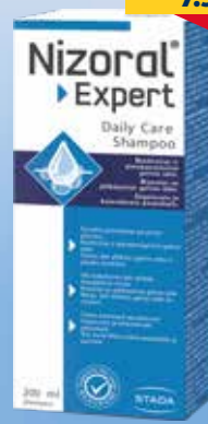
NIZORAL Expert Daily Care galvas ādu nomierinošs pretblaugznu šampūns 200 ml