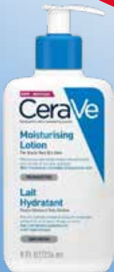
CeraVe mitrinošs losjons sausas, ļoti sausas ādai 236 ml