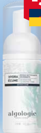
ALGOLOGIE Hydra Écume - Oxygenating attīrošas putas 120 ml