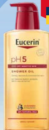
EUCERIN pH5 dušas eļļa jutīgai, sausiai ādai 400 ml