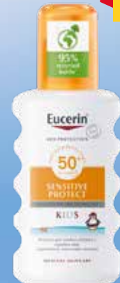
EUCERIN Sun Kids Sensitive Protect SPF 50+ izsmidzināms saules aizsarglīdzeklis bērniem 200 ml