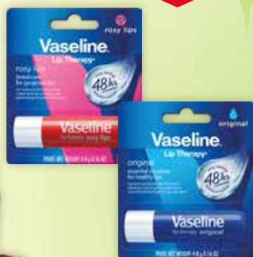
Vaseline Original, Rosy Lips lūpu balzams 4,8 g, ikdienas kopšana lūpām