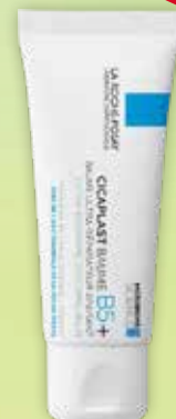
LA ROCHE-POSAY Cicaplast Baume B5+ nomierinošs balzams 40 ml