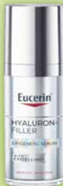
Eucerin Hyaluron-Filler Epigenetic serums ādas novecošanās pazīmju samazināšanai 30 ml