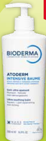
BIODERMA Atoderm Intensive Baume balzams sausai un atopiskai ādai 500 ml