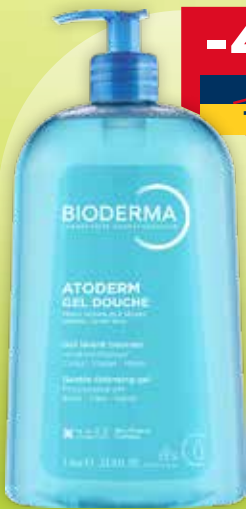
Bioderma Atoderm dušas želeja hipoalerģiska, bez parabēniem 1L