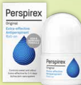
PERSPIREX Original antiperspirants aizsardzībai pret svīšanu 3-5 dienu garumā 20 ml