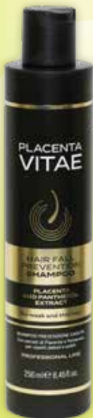
PLACENTA VITAE šampūns pret matu izkrišanu 250 ml