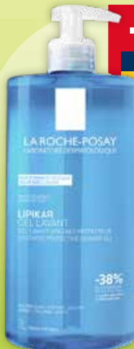
LA ROCHE-POSAY Lipikar Gel Lavante attīroša želeja ar nomierinošu efektu 1 L