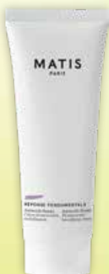
MATIS Reponse Fondamentale Authentik-Beauty atjaunojošs sejas krēms 50 ml