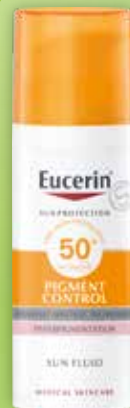
Eucerin Sun Pigment Control SPF50+ saules aizsarglīdzeklis 50 ml