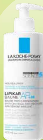
LA ROCHE-POSAY Lipikar Baume AP+M balzams sausai ādai 400 ml