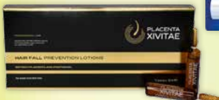
Placenta XIVITAE losjons pret matu izkrišanu ampulas N12 x 10 ml