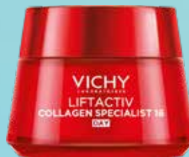
VICHY Liftactiv Collagen Specialist dienas krēms ar kolagēnu 50 ml