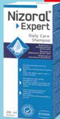
NIZORAL Expert Daily Care galvas ādu nomierinošs pretblaugznu šampūns 200 ml