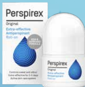
PERSPIREX Original antiperspirants aizsardzībai pret svīšanu 3-5 dienu garumā 20 ml