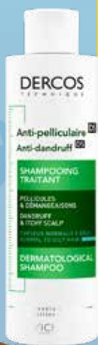
VICHY Dercos šampūns pret blaugznām taukainiem matiem 200 ml