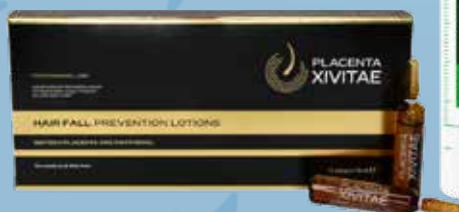
Placenta XIVITAE losjons pret matu izkrišanu ampulas N12 x 10 ml