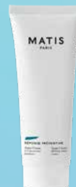
MATIS Reponse Preventive Aqua mitrinošs sejas krēms 50 ml