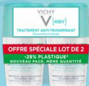
Vichy Deo 48H dezodorants jutīgai ādai N2