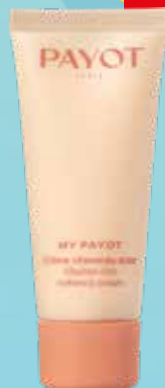
PAYOT Vitamin Rich Radiance mitrinošs sejas krēms 30 ml