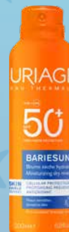
Uriage Bariesun dry mist SPF50+ izsmidzināmais līdzeklis jutīgai ādai 200 ml