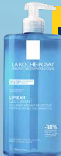
LA ROCHE-POSAY Lipikar Gel Lavante attīroša želeja ar nomierinošu efektu 1 L