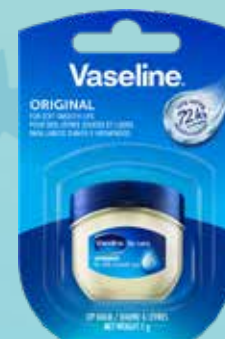
VASELINE Original lūpu balzams ilgstošai mitrināšanai 7 g