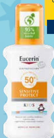
EUCERIN Sun Kids Sensitive Protect SPF 50+ izsmidzināms saules aizsarglīdzeklis bērniem 200 ml