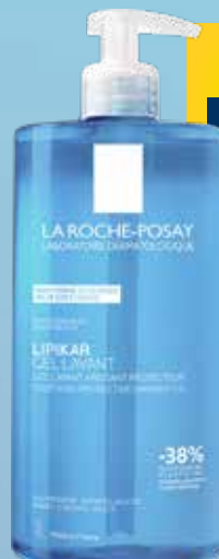
LA ROCHE-POSAY Lipikar Gel Lavante attīroša želeja ar nomierinošu efektu 1 L